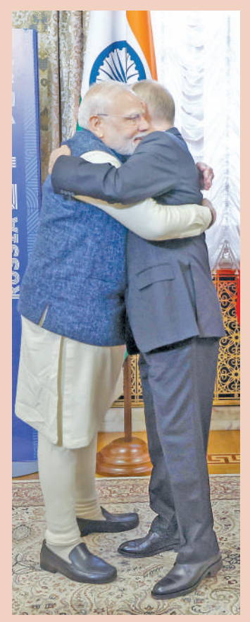
కజన్ రెడ్డి అధ్యక్షుడు పుత్తినను ఆత్మీయ ఆలింగనం చేసుకున్న ప్రధాని మోడీ